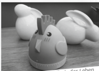
Die Zeit läuft - der Test, der Leben retten kann!