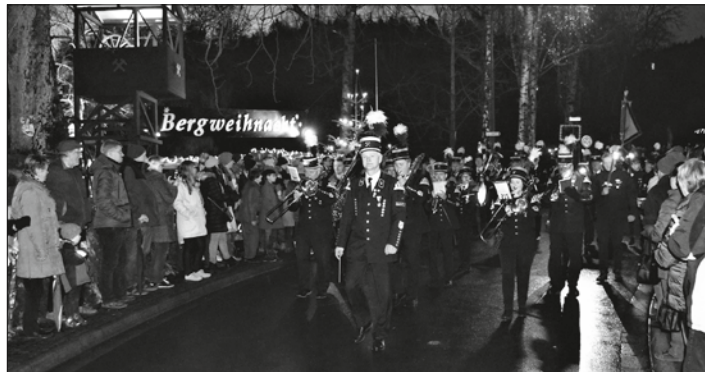
Eindrucksvoll die Bergparade anlässlich der Stockheimer Barbarafeier vor einer großen Zuschauerkulisse im Bereich des bergmännischen Weihnachtsmarktes.