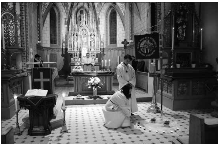
Ministranten entzünden zu den Fürbitten die Kerzen welche die Friedensstandarte umrahmen in Mahnung an den Frieden.