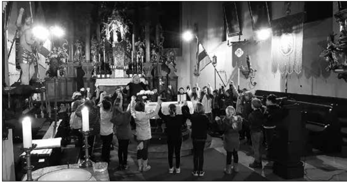
Im ersten Weggottesdienst in Glosberg beschäftigten sich die Kinder mit dem Thema „Taufe“.

Glosberg – Die Erstkommunionkinder des kommenden Jahres aus den Pfarreien Glosberg, Neukenroth und Stockheim haben begonnen, sich auf das große Fest vorzubereiten. Bei einem gemeinsamen Wochen-