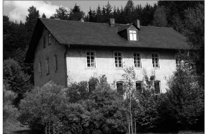
Noch in diesem Jahr erfolgen umfangreiche Sanierungsarbeiten an der bergmännischen Rentei von 1847. Geplant ist die Entstehung eines Kulturzentrums sowie einer Begegnungsstätte am Bergwerksgelände.

So komme es in den nächsten Monaten zu erfreulichen baulichen Aktivitäten. Neben dem Neubau von insgesamt 38 Wohneinheiten auf dem freien Gelände in der Nähe des Bahnhofes Stockheim und der geplanten acht Einfamilienhäuser an der Sportplatzstraße werden auch die umfangreichen Sanierungsarbeiten an der bergmännischen Rentei von 1847 auf dem ehemaligen Zechengelände beginnen. Vorgesehen sei die Entstehung eines Kulturzentrums und einer Begegnungsstätte am Bergwerksgelände. Mit dem zukünftigen Wohnungsangebot in Stockheim werde ein dringendes Bedürfnis vieler Interessenten befriedigt werden können, so