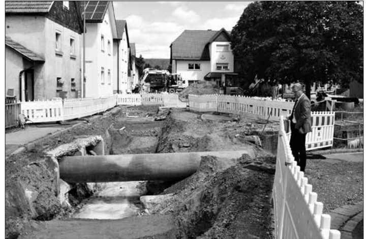
Das Reitscher Ortszentrum ist derzeit eine riesige Baustelle. Nach Beendigung aller Baumaßnahmen einschließlich „kleine Dorferneuerung“ wird die Lebens- und Wohnqualität erheblich gesteigert. Über den Baufortschritt zeigt sich Bürgermeister Rainer Detsch (rechts) sehr zufrieden.

Brücken-, Kanal- und Trinkwasserleitungsbau. Nach Beendigung aller Maßnahmen – die Bürgerschaft ist bei der Planung mit einbezogen worden – werden Lebens- und Wohnqualität des 700 Einwohner zählenden Gemeindeteils im Ortskern erheblich verbessert sein, ist sich das Gemeindeoberhaupt sicher. Die Verschönerungen am Dorfplatz und in seinem unmittelbaren Umgriff mit weitreichenden Umgestaltungsmaßnahmen sowie der Um- und Ausbau des Grünbaches auch im Ober- und Unterlauf als wesentlich verbesserter Hochwasserschutz erfolgt im nächsten Jahr. Mit staatlicher Förderung im Rahmen der Dorferneuerung sind zwischenzeitlich schon zwei marode Häuser abgerissen worden. Die frei gewordenen Flächen werden einer neuen Nutzung zugeführt. So gibt es Platz für eine von der