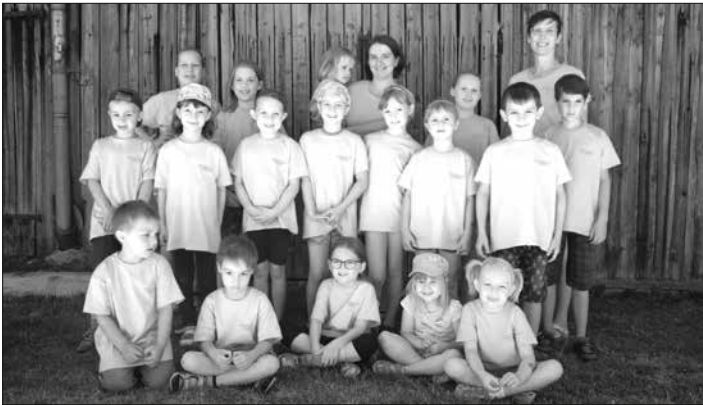
Die Kinder der Reitscher Kinderfeuerwehr freuen sich über die gesponserten T-Shirts für ihre neuen Mitglieder.