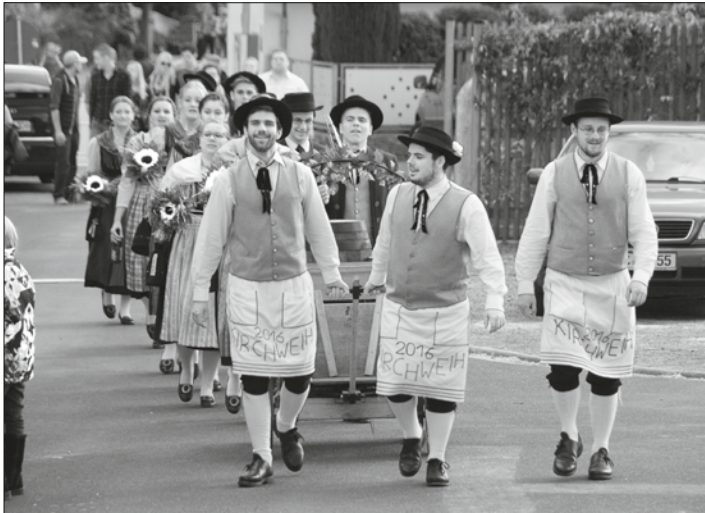
Ein schönes Bild, wenn die Kerwapaare am Plan einziehen.

Nach dem Frühschoppen in der Zecher-Halle müssen die Einhaburschen mit der Bläsergruppe wieder früh losziehen, damit alle