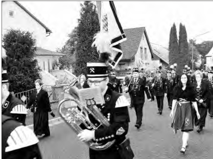
Zwei Tage stand Stockheim im Zeichen des Bergmannsfestes. Einer der Höhepunkte war die Bergparade.

Stockheim – Das zweitägige Bergmannsfest von Knappenverein, Bergmannskapelle und Förderverein „Bergbaugeschichte“ nahm unter der Schirmherrschaft von Bürgermeister Rainer Detsch einen erfolgreichen Verlauf.