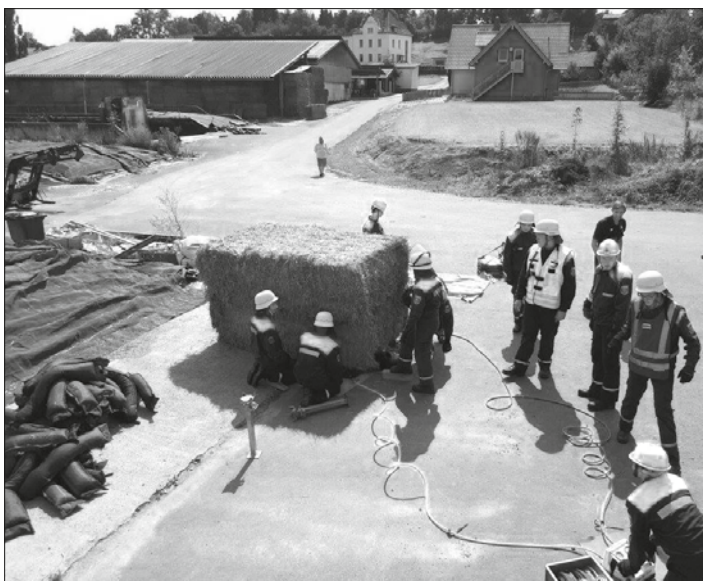
Unter einem Pressballen war ein Landwirt und musste gerettet werden.

Stockheim – Ende August fand wieder ein sogenannter Berufsfeuerwehrtag im Gerätehaus der FF Stockheim statt.