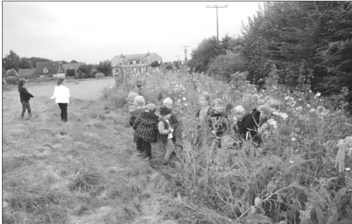
Was für ein Anblick voller Farbenvielfalt und dann der Duft. Die Kinder vom Kindergarten Neukenroth können gar nicht genug schnuppern und riechen an der herrlichen Blütenpracht ihrer vielfältigen Blumen- und Kräuterwiese.