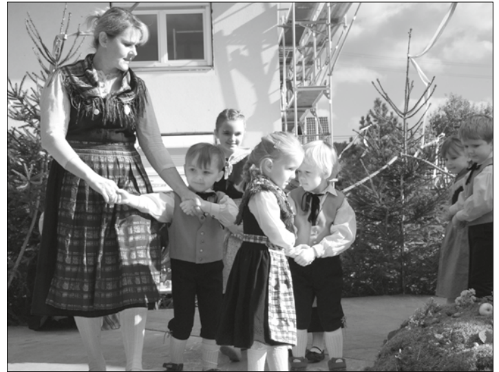
Schon die jüngsten Zecherinnen und Zecher zeigen ihr Können am Plan.

Rosenau 8 - 96342 Stockheim-Neukenroth - Telefon 0 92 65-13 48