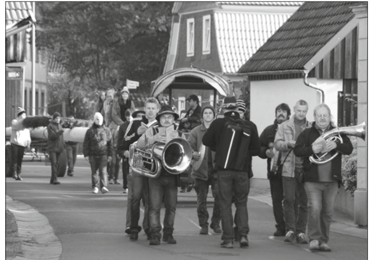
Mit viel Tam-Tam wird der Kerwabaum zum Dorfplatz gefahren, wobei die Mahla auf dem Baum sitzend mitfahren dürfen.

Die Zecher-Jugendlichen sind es, die fast ausschließlich die Einhaltkirchweih alleine organisieren. Sie sind darin mittlerweile seit vielen Jahren geübt. Daher sind die