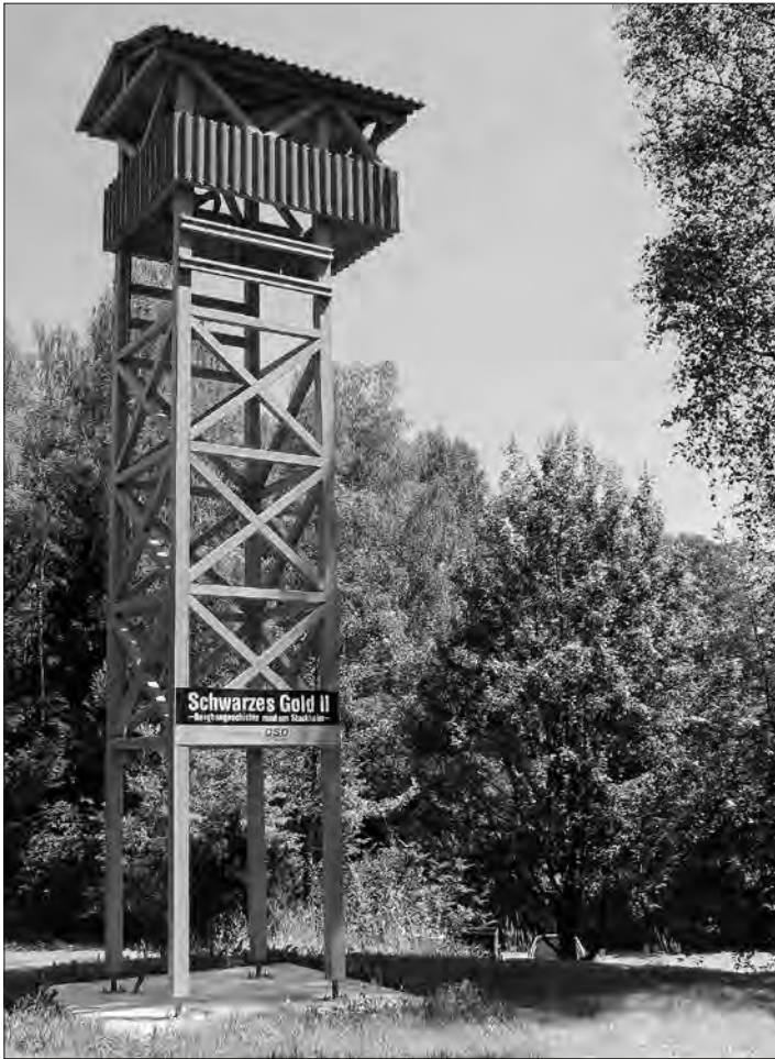
Seit einigen Monaten hat St. Katharina wieder einen acht Meter hohen Förderturm.