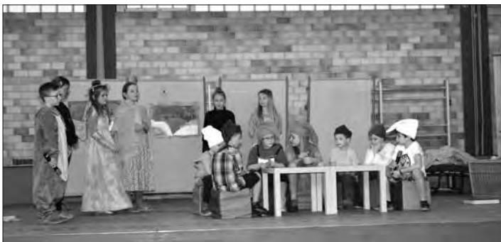
Alles wird gut! Auf einer turbulenten Zugfahrt erleben die Fahrgäste einen außergewöhnlichen Aufenthalt mitten im Märchenwald. Da hilft nur der „Notruf aus dem Märchenwald“.

Reitsch – An der „Glück Auf“ Grundschule Stockheim wird schon lange Theater gespielt. Die Aufführungen werden immer besser. In der Turnhalle des Schulgebäudes in Reitsch begeisterten die kleinen Schauspieler vor rund 300 großen und kleinen Zuschauern mit dem Theaterstück „Notruf aus dem Märchenland“. Dass dies so ein großer Erfolg vor zahlreichen Publikum