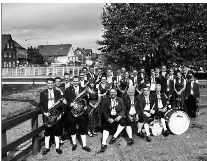
Voller Erwartung sind die Musikerinnen und Musiker und freuen sich sehr auf Ihren Besuch und einen tollen, gemeinsamen Konzertabend.