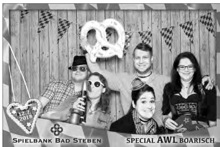
Die Fotos der setalephotoBOX können passend zu einem Motto auch mit einem individuellen Layout versehen werden.