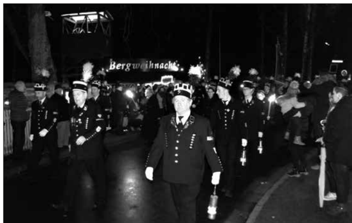
Eindrucksvoll - die Bergparade anlässlich der Stockheimer Barbarafeier.