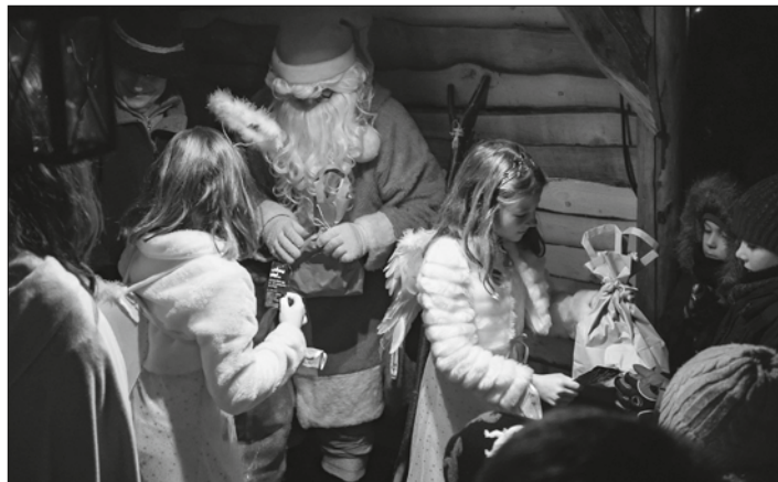
Der Nikolaus verteilte mit seinen Engelein Nikolaus-Päckchen, randvoll gefüllt mit Süßigkeiten und kleinen Überraschungen, an die freudestrahlenden Kinder aus der Großgemeinde Stockheim.

Stockheim – Seiner Zeit etwas hinterher war heuer der Stockheimer Nikolaus. Da er an seinem Ehrentag unter der Woche wohl im Dauereinsatz war, machte er den Jungen und Mädchen der Großgemeinde Stockheim erst am Sonntagabend seine Aufwartung. Der Freude der Kinder darüber tat dies aber keinerlei Abbruch; warteten sie doch auch heuer voller Vorfreude auf das Erscheinen des Heiligen Mannes – wohlwissend, dass dieser wieder jede Menge schöne Geschenke für sie mitbringen wird. Eingebettet ist die kleine Nikolausfeier alljährlich in die Bergmännische Weihnacht, die bereits zum zwölften Male vom Förderverein Bergbaugeschichte Stockheim/Neuhaus in Verbindung mit dem Knappenverein und der Bergmannskapelle organisiert wurde. Die – dem