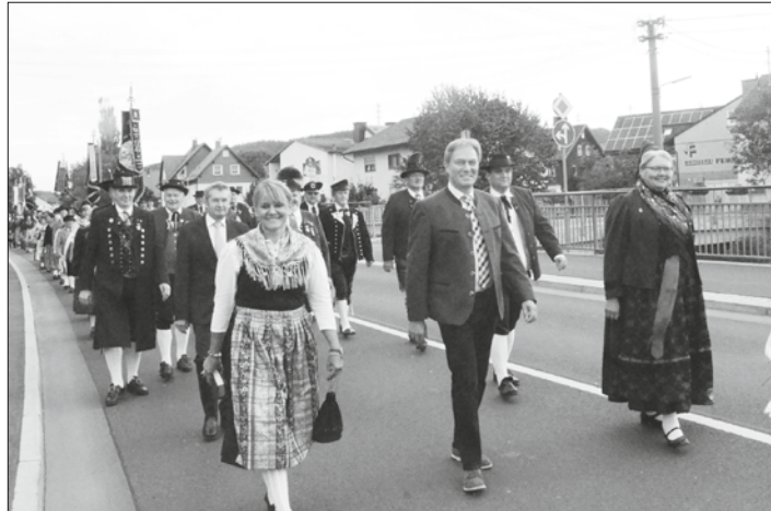
Impression eines faszinierenden farbenprächtigen und fröhlichen Festzuges durch Neugrua.

Neukenroth – In Neugrua fand anlässlich des 40-jährigen Bestehens des Volkstrachtenvereins Zechgemeinschaft Neukenroth eine große Demonstration der ehrenamtlichen Brauchtumpflege, Trachten und Tradition statt. Der Volkstrachtenverein Zechgemeinschaft Neukenroth feierte am Wochenende sein 40. Jubiläum. Neben mehreren anderen Festaktivitäten war der Festzug am Sonntagmittag herausragender Höhepunkt. Circa 800 Festzugteilnehmer bildeten ein farbenfrohes Bild durch Neugrua. Die Neugrüete Trachtenbewegung zeigt, dass sie Spitze in Oberfranken ist und Anerkennung aus dem gesamten Bezirk findet. Aber nicht nur Trachtler machten dem Jubelverein ihre Aufwartung und drückten ihre Anerkennung und Wertschätzung aus, sondern auch hunderte von Zuschauern bestaunten den farbenprächtigen Trachtenumzug und spendeten reichlich Beifall. Unter den Klängen der fünf Musikkapellen, Bergmannskapelle Stockheim, Musikverein Neukenroth, Leuchsen-