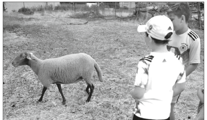
Das „Coburger Fuchsschaf“ ist schon längst eine Rarität geworden.