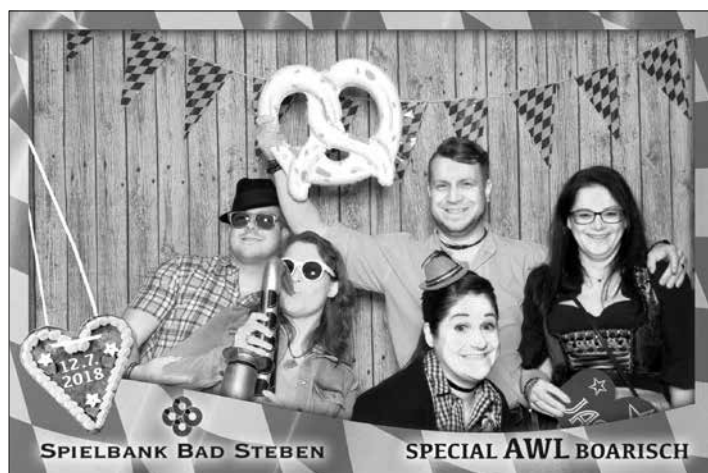
Die Fotos der setalephotoBOX können passend zu einem Motto auch mit einem individuellen Layout versehen werden.