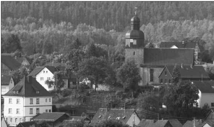
Im Mittelpunkt der Burggruber Kirchweih steht die St.-Laurentius-Kirche mit ihrem spätgotischen Flügelaltar.