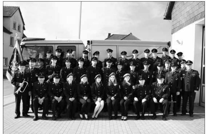
Die FF Burggrub lädt zum Festkommers zum 125-jährigen Jubiläum ein.