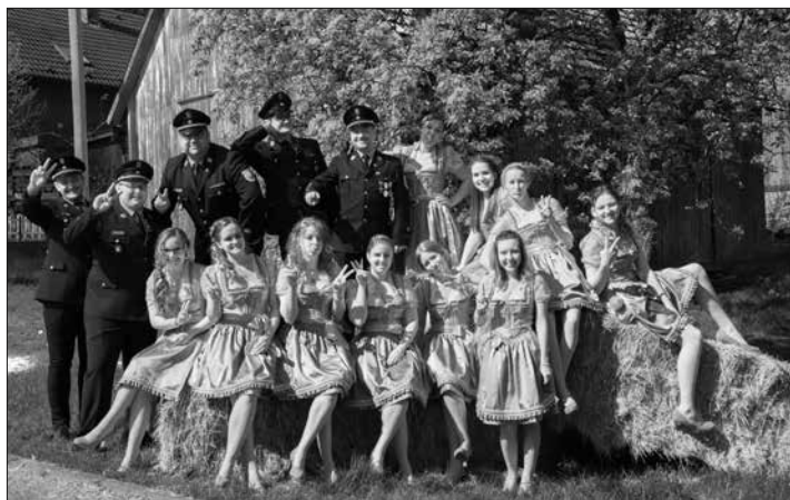
Nach langer Vorbereitungszeit freuen sich nun alle auf die Feierlichkeiten zum 125-jährigen Jubiläum der Freiwilligen Feuerwehr Burggrub.