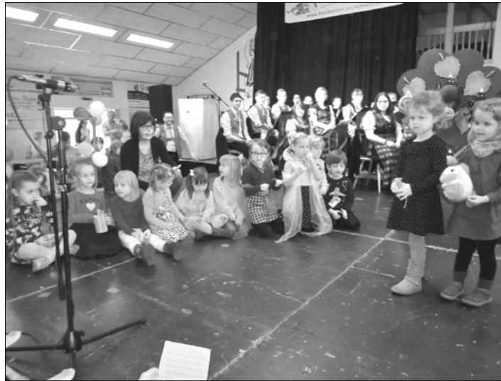
Die Kleinen des katholischen Kindergartens Haßlach bei ihrem Auftritt.