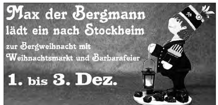
Das neue Logo lautet „Max, der Bergmann“.