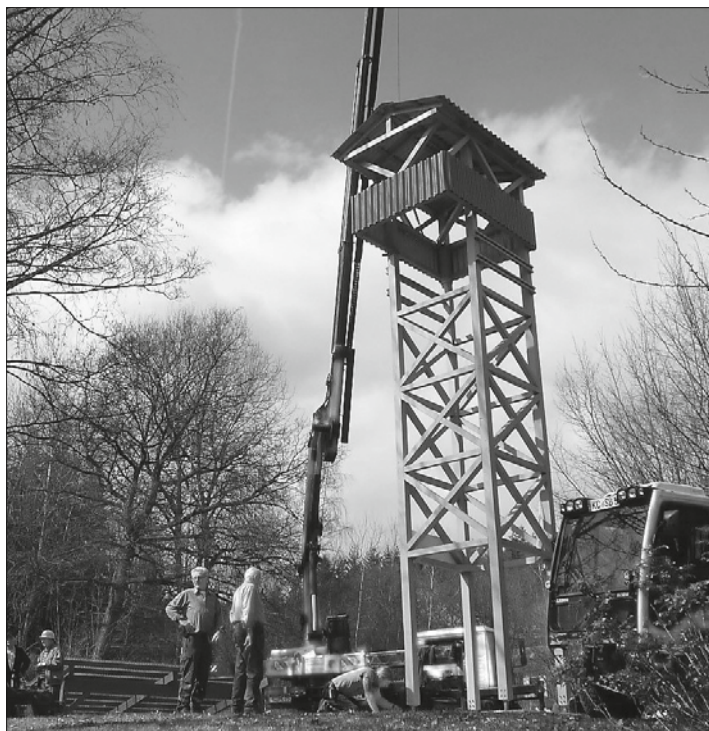
Dank ehrenamtlicher Initiative haben die Stockheimer wieder einen acht Meter hohen Förderturm auf dem ehemaligen Bergwerksgelände.