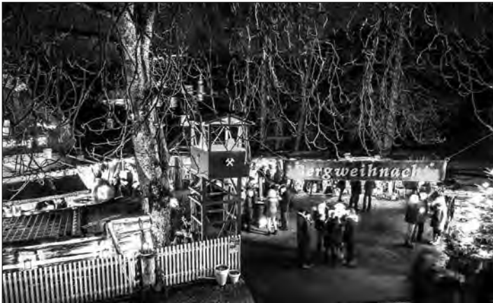
Einzigartiges Flair der Stockheimer Bergweihnacht mit Förderturm.