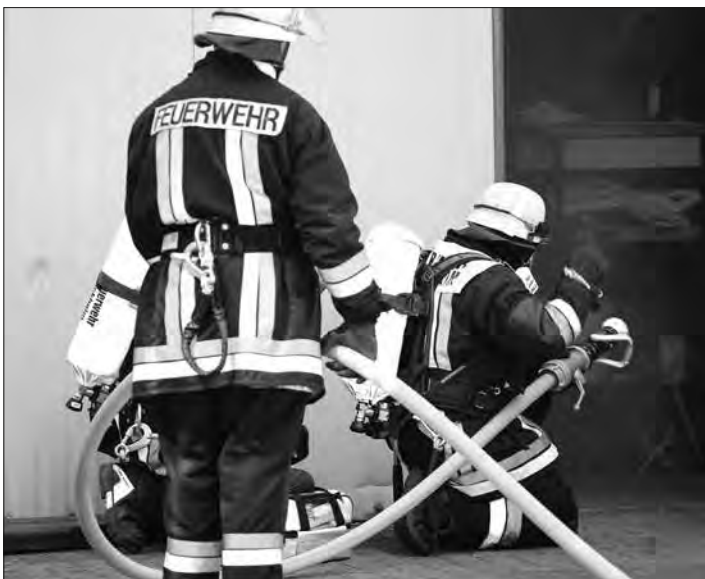
Zu Übungszwecken wurde die weitläufige und recht verwinkelte Halle der Spedition Lenker in dichten Nebel versetzt.