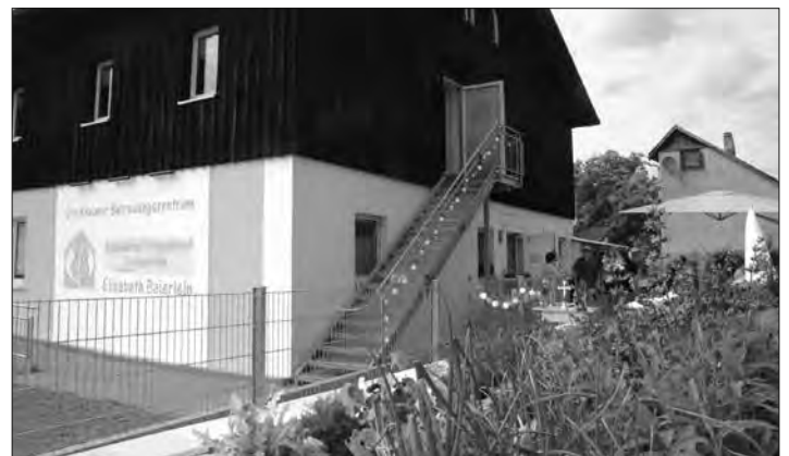
Ein buntes Blumen- und Blütenmeer lädt zum Verweilen und Wohlfühlen im Garten am Betreuungszentrum Stockheim ein.

Anmeldungen für alle Kurse: Tel. 09265-8069444