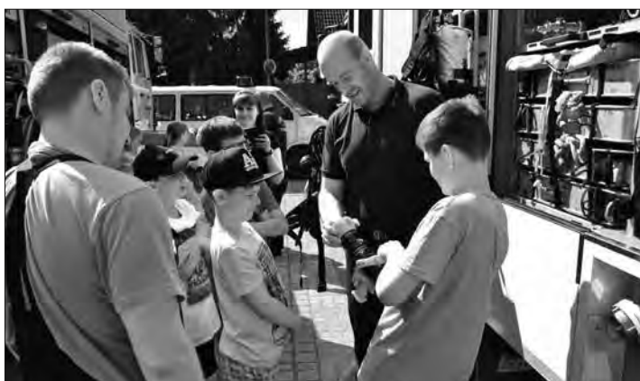
Ein kompletter Schultag stand Schülern und Lehrern der Grundschule für die Brandschutzerziehung zur Verfügung.