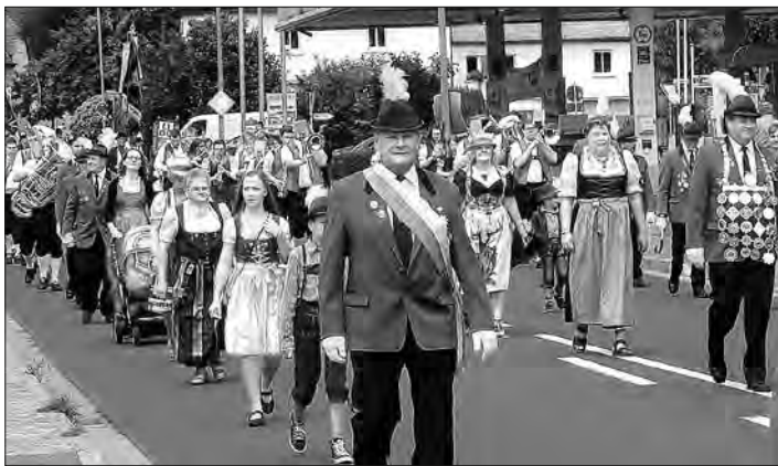
Einer der Höhepunkte des Stockheimer Schützenfestes ist der Festzug durch die ehemalige Bergwerksgemeinde. Start ist heuer am Rathaus.