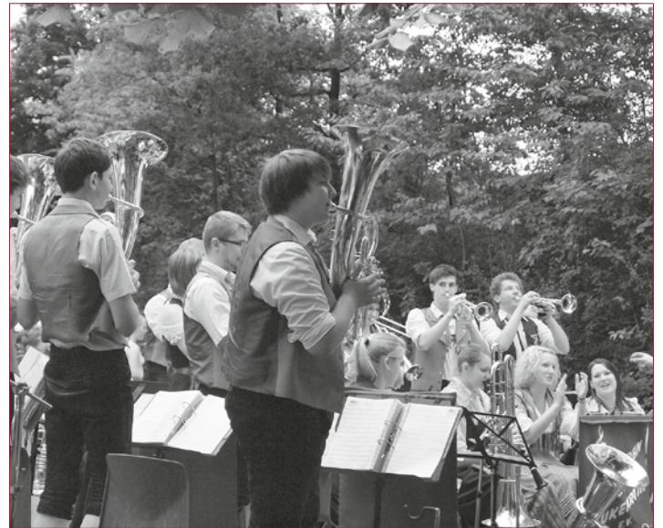
Am Sonntag ab 15.30 Uhr spielt der Musikverein Neukenroth und sorgt für einen kurzweiligen Nachmittag.