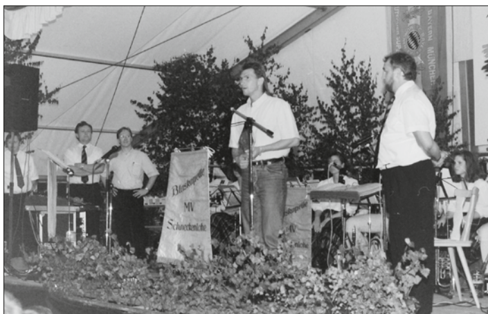
Besuch von Klaus Augenthaler im Jahr 1992 zum 25jährigen Jubiläum.