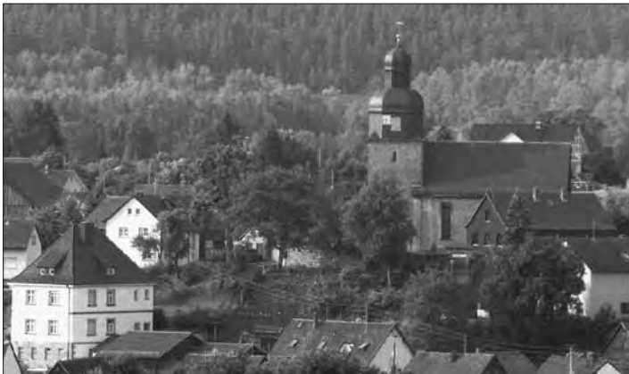
Im Mittelpunkt der Burggruber Kirchweih steht die St.-Laurentius-Kirche mit ihrem spätgotischen Flügelaltar.

Burggrub – Die traditionelle Kirchweih in Burggrub wird am dritten Wochenende im Juli vom 13. bis 17. Juli gefeiert.