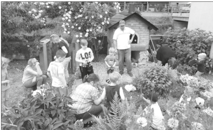
Die Forscherkids bei der Arbeit im Gärtla.

Neukenroth – In großer Zahl trafen sich die Forscherkids des Obst- und Gartenbauvereins Neukenroth in den Pfingstferien, um den ersten Arbeitseinsatz im Gärtla zu durchzuführen. Bevor es draußen ans Werk ging, wurde im Stübli Brotteig geknetet und geformt, der anschließend in den vorgeheizten Steinbackofen geschoben wurde. Nach einer kurzen Erläuterung über die Pflanzen, die dieses Jahr in die Beete gesetzt werden sollen, ging es mit Begeisterung ans Werk. Es wurde Verblühtes entfernt, Unkraut