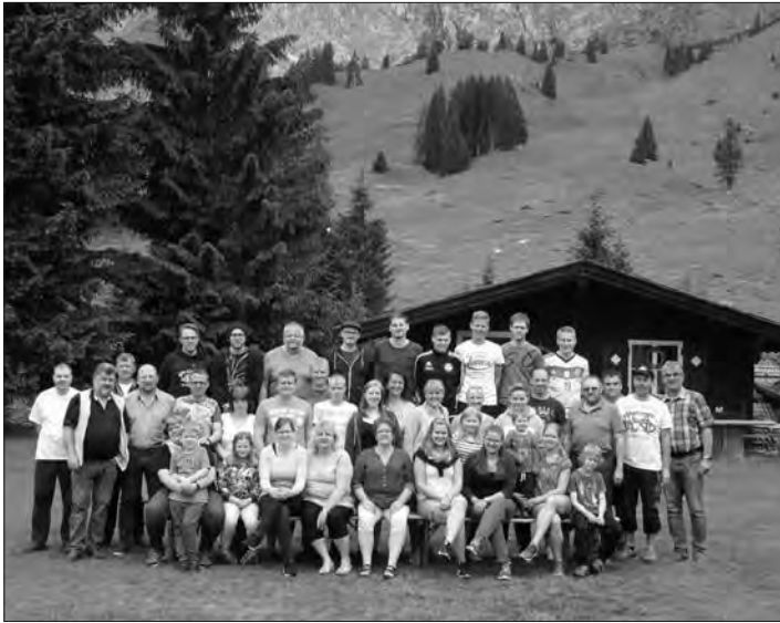
Die Neukenrother Zecher inmitten der beeindruckenden Natur der Stockheimer Partnergemeinde Mühlbach am Hochkönig.

Neukenroth – Der Volkstrachtenverein „Zechgemeinschaft Neukenroth“ verbrachte vier schöne Tage in der Partnergemeinde von Stockheim in Mühlbach am Hochkönig. Nach der Beurkundung der