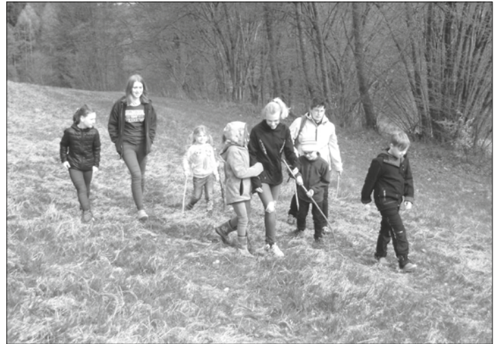
Text und Bild: Martina Beetz

Die Wanderung war ein aufregender Tag für die Kids, an dem sie viel erlebten, entdeckten und lachen konnten. Außer den mit Ostereiern vollgestopften Taschen gab es am Ende viel zu erzählen.