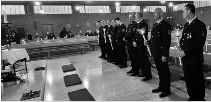
Am späten Abend begleiteten die „Älteren Raspler“ die Auferstehungsfeier als Messdiener.