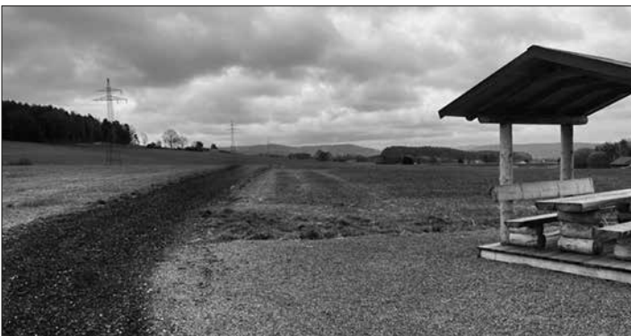
Fräsgut als günstige Möglichkeit, die Flurwege zu renovieren.