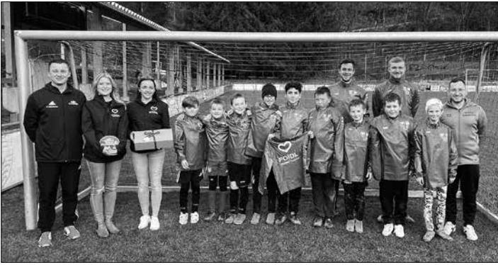
Stolz präsentieren die Junioren die neuen Regenjacken.

Neukenroth-Pressig-Rothenkirchen – Die Häusliche Kranken- & Altenpflege Elisabeth Foidl GbR mit ihren Pflegestützpunkten in Kronach und Pressig spendete neue Regenjacken für die E-Junioren der SG Neukenroth - Pressig - Rothenkirchen.