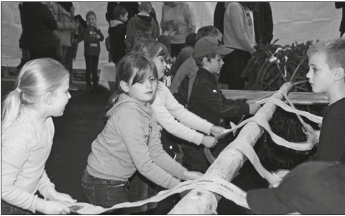
Mit Eifer haben die Kinder der Kindertanzgruppe dabei geholfen ihren Kinderkirchweihbaum zu schleifen.

Neukenroth – Die Tradition der Einhaltkirchweih hat in Neukenroth ein weiteres Highlight bekommen. Die Neukenrother Kerwa hat nun auch einen Kinderkirchweihbaum. Nachdem im letzten Jahr auf dem Areal der Zecherhalle die neue Tanzlinde gepflanzt wurde, haben die Neukenrother Zecher für die Kindertanzgruppe zusätzlich einen Kinderkirchweihbaum aufgestellt. Daher war bereits am Samstag bei regnerischem Wetter in der Zecherhalle schon sehr viel los. Die Kinder durften ihren Baum gemeinsam mit den Einhaltern schleifen und ein Schild für den Baum bemalen. Der kleine Kirchweihbaum wurde neben der Einfahrt zur Zecherhalle aufgestellt und erfreut nicht nur die Kinder. Auch am Sonntag konnten die zweiundzwanzig kleinen Zecher und Zecherinnen der Kindertanzgruppe dann in der Zecherhalle ihre Tänze vorführen und zeigen, dass sie als spätere Einhalter bereit sind.