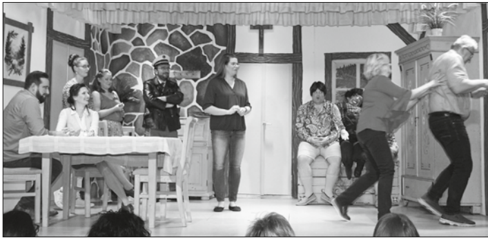
Eine Leiche stört ein heimliches Rendezvous im Landgasthof. Der Theaterverein „Frohsinn“ Neukenroth begeisterte nach zwei Jahren Pause mit dem Stück „Rondewu mit ahne Leich“.