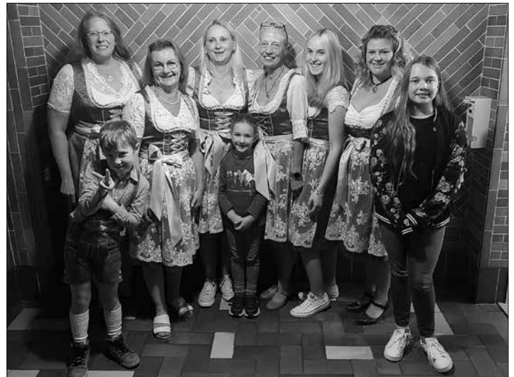
Der Schützenhort hat sich im Sommer entschlossen, einheitliche Dirndl für unsere Schützendamen anzuschaffen. Die Auswahl ist gut gelungen, so werden unsere Damen bei den Schützenumzügen ein schönes Bild abgeben.