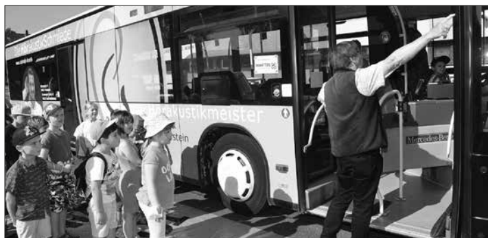
Angehende ABC-Schützen der Glück Auf-Grundschule Stockheim lernen das richtige Verhalten beim Schulbusfahren.