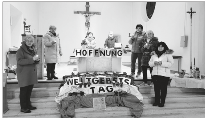
Die Frauen des Vorbereitungsteam in der Stockheimer Pfarrkirche St. Wolfgang mit den Hoffnungslichtern um den Weltgebetstags-Altar.

In Stockheim war der kath. Frauenbund St. Wolfgang in diesem Jahr für die Ausführung zuständig. Das Thema der weltweiten Gebetsinitiative war dem Buch des Propheten Jeremia entnommen: „Ich werde euer Schicksal zum Guten wenden“. Zum Beginn wurde an die vielen Frauen erinnert, die ganz aktuell aus der Ukraine mit ihren Kindern fliehen müssen, um dem Angriffskrieg zu entfliehen. Aber auch die Frauen aus England, Wales und Nordirland habe neben den vielen Gemeinsamkeiten und einer wunderschönen Natur auch viele Probleme, die eine multikulturelle, multiethnische und multireligiöse Gesellschaft mit sich bringt. Diese Frauen nehmen die Verheißung Gottes im alttestament-