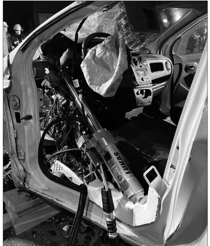
Unter Einsatz von zwei Sätzen hydraulischen Rettungsgerätes wurde der schwer verletzte Fahrer befreit.