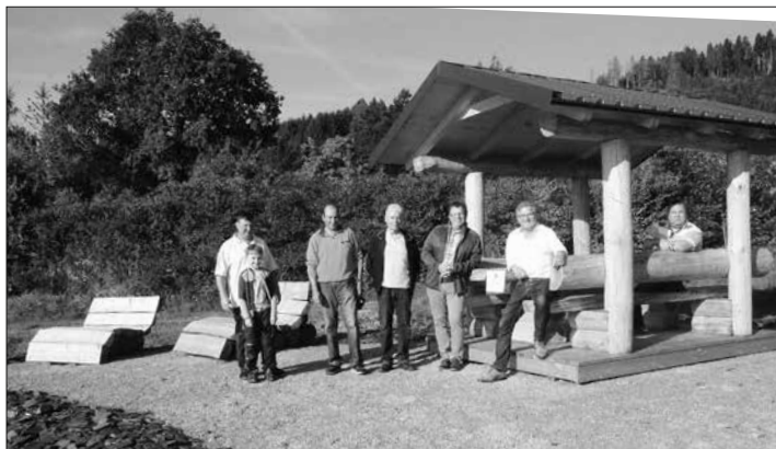
Übergabe einer überdachten Sitzgruppe mit zwei Liegen.