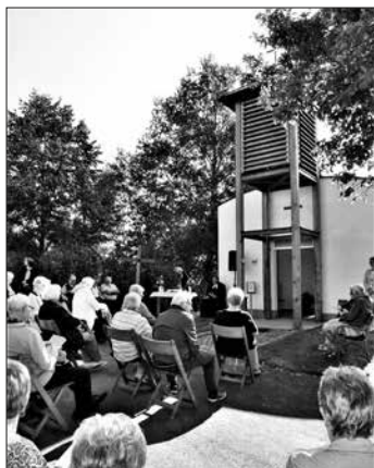
Eindrucksvoll gestaltet wurde der Kirchweihfestgottesdienst.

Burggrub – Die Erbauung der Grenz- und Friedenskapelle Burggrub an der ehemaligen mit Stacheldraht, Minenfeldern, Todesschussanlagen und Wachtürmen abgesicherten deutsch-deutschen Grenze zwischen dem bayerischen Burggrub und dem thüringischen Neuhaus-Schierschnitz ist seit 1992 eine beispielhafte Privatinitiative, die