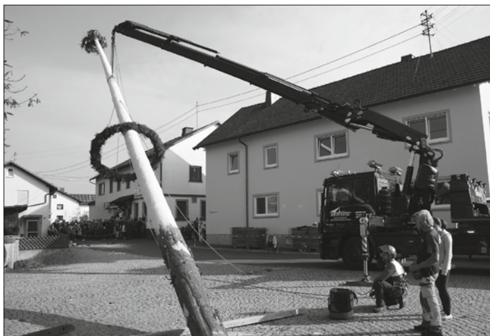
Wenn am Samstag Vormittag der Kirchweihbaum aufgestellt wurde, war das für die Neukenrother Bürger immer ein Highlight.

Auch die Gaststätten werden die bekannten Kirchweihspeisen anbieten und erbiten aufgrund der Auflagen und reduzierter Plätze um rechtzeitige Anmeldung. Auch hier bitten alle Beteiligten die aktuellen Coronaregeln zu beachten.