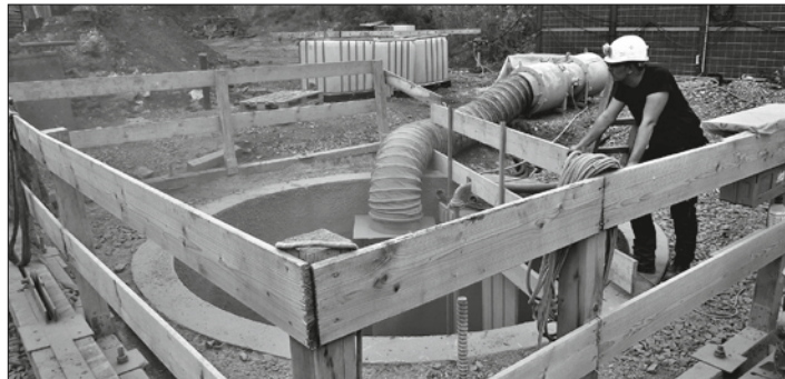
Wieder geöffnet wird der ehemalige Förderschacht der Zeche St. Katharina bis auf 35 Meter.