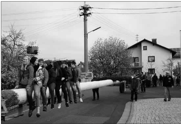
Die Neukenrother Zecher planen momentan, wie die Kirchweih in Corona-Zeiten dennoch, wenn auch anders, durchgeführt werden kann. Ob ein Kirchweihbaum aufgestellt werden kann, wird sich erst noch zeigen.

Nachdem das Datum der Weihe der Pfarrkirche St. Katharina nicht be-