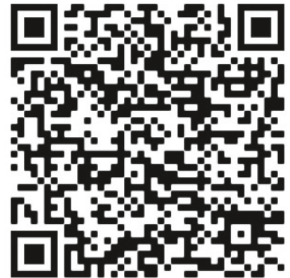
QR-Code Ferienspaß Frankenwaldverein

Von sehr leicht bis mittelschwer und sehr kurz bis mittellang reicht die Bandbreite der Wandervorschläge. Da ist bestimmt für jede Familie was dabei!