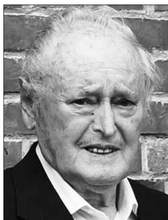
Im Alter von 91 Jahren verstarb Otto Heinlein.

Die über 40-jährige Zonengrenze und vor allem die „Wende“ nach 1989 ließen sein Fotoarchiv nochmals kräftig anschwellen.