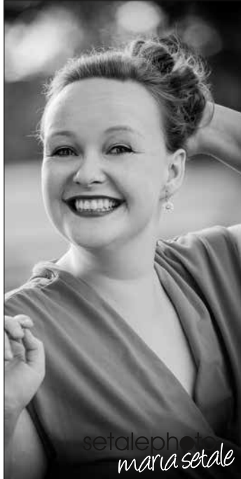
Portraitshootings in der Natur sind zu jeder Jahreszeit beliebt.

Stockheim – Jungen Familien attraktive Rahmenbedingungen zu bieten, ist eine der großen Herausforderungen unserer Kommunen und ein wesentliches Ziel der Kommunalpolitik.